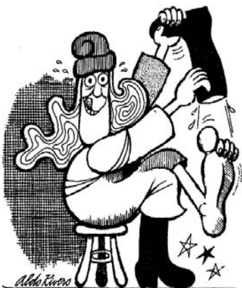
La república se saca las botas militares, por Aldo Rivero, 1973