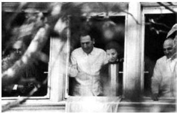
Perón en 1972-casa de Gaspar Campos