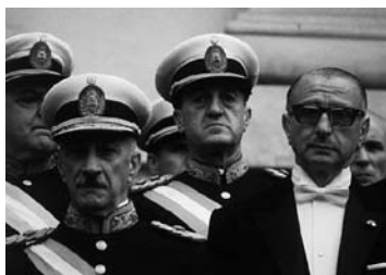
Onganía junto a Krieger Vasena (de smoking)