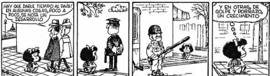
Mafalda, por Quino, 1967