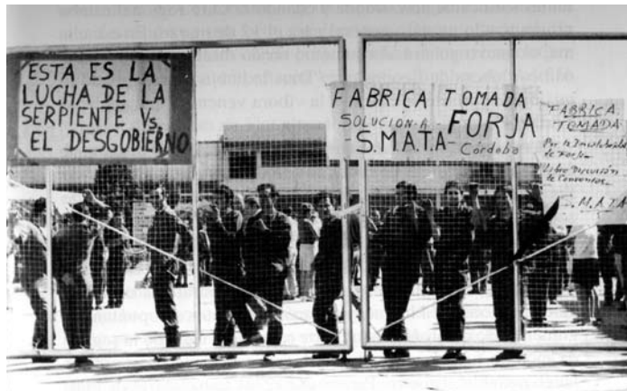
Fábrica tomada en el Vïvorazo

ERP, su familia aceptó que el féretro fuera envuelto en una bandera de esa agrupación, como símbolo de odio a la dictadura. Las cámaras periodísticas registraron ese fenómeno inusual de la presencia de organizaciones armadas en un sepelio multitudinario. El Vïborazo no sólo provocó la renuncia del gobernador de Córdoba, sino también la destitución del general Levingston por la Junta de Comandantes, en marzo de 1971.