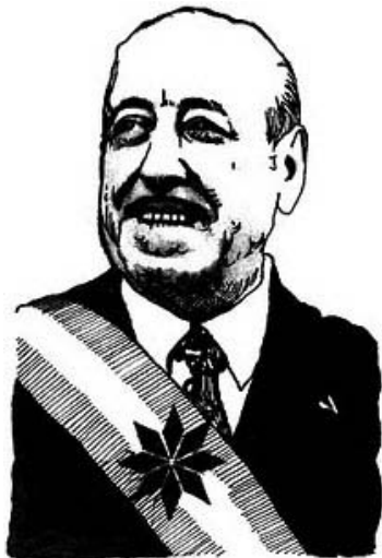
Cámpora presidente, dibujo de Juan Britos