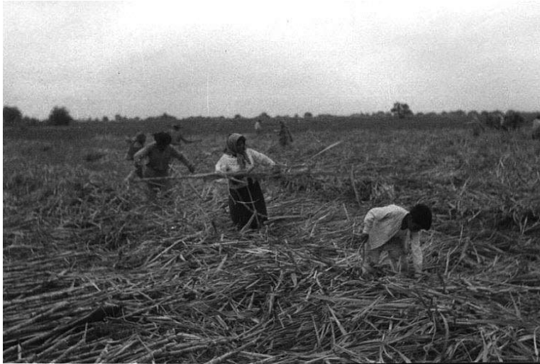
Familias trabajando en la cosecha de caña de azúcar