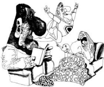
Perón y Cámpora, por Sabat