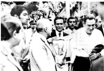
Regreso de Perón en 1972