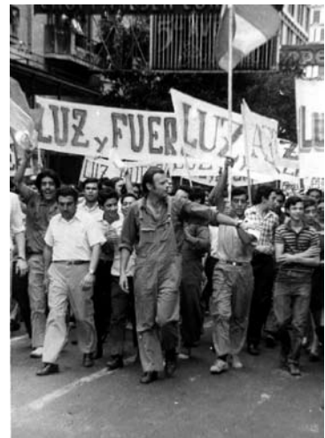
Agustín Tosco al frente de la columna de Luz y Fuerza en el Cordobazo