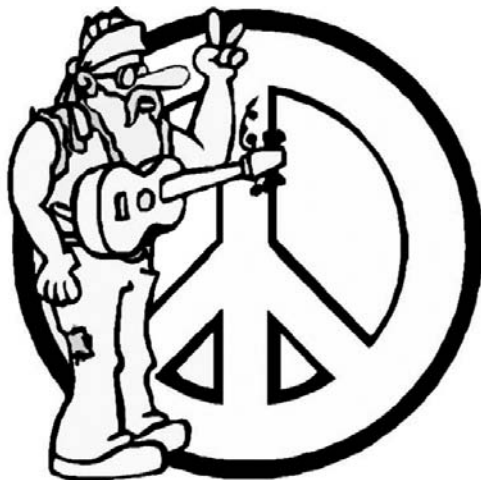
Hippie para colorear

Bronca sin fusiles y sin bombas. Bronca con los dos dedos en "V". Bronca que también es esperanza: Marcha de la bronca y de la fe.