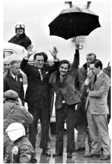
Perón y Rucci en Ezeiza, 1972

También Perón tuvo una reunión con un numeroso grupo de sacerdotes tercermundistas, de la que algunos salieron muy satisfechos y otros decepcionados, porque vieron que Perón no se pondría a la cabeza de una revolución socialista. Después de reuniones con distintos sectores, Perón volvió a España para preparar su regreso definitivo a la Argentina (que ocurrió unos meses más tarde, el 20 de junio de 1973).