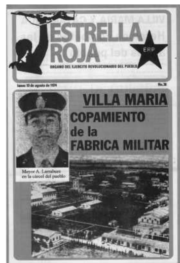
Estrella Roja, la revista del ERP informa sobre el copamiento de una fábrica militar en Villa María, 1974