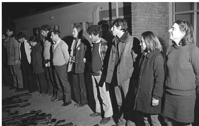
Presos políticos capturados en Trelew