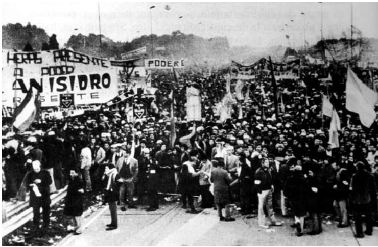
Manifestantes dirigiéndose a Ezeiza el 20 de junio de 1973