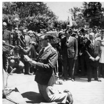
Onganía rezando una plegaria en un acto en Luján

Un amplio sector de la población era indiferente al levantamiento, ya sea por influencia del periodismo, o por ser peronistas y estar excluidos de la política.