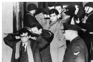
Fila de estudiantes detenidos