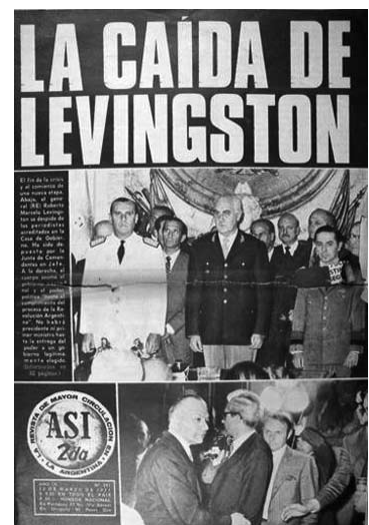
Tapa de revista Así, marzo de 1971

La reacción popular cordobesa no se hizo esperar y fue denominado Viborazo en alusión a los dichos del Gobernador-Interventor. La CGT resolvió un paro activo y una marcha en repudio. Ese día (12/3/71), la represión mató a un obrero adolescente. Si bien el joven no era militante del