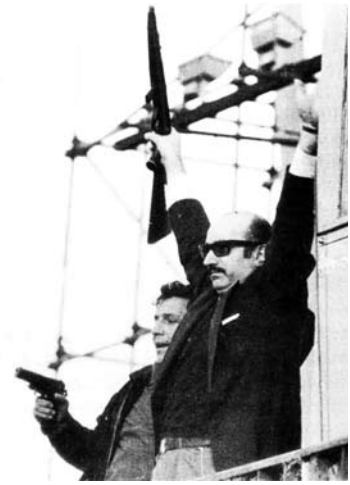
Hombres armados copan el palco preparado para el regreso de Perón